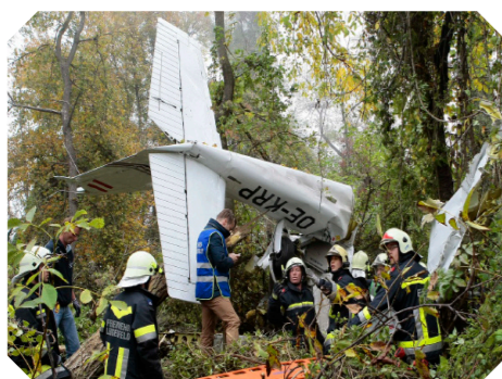
Flugzeugabsturz Gneixendorf am 20. Oktober