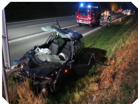
Verkehrsunfall B37 am 12. Oktober