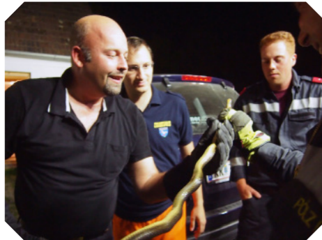
Tierrettung Schlange in der Schickenberggasse am 19. Juli