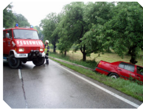
Verkehrsunfall am 12. Juni auf der LH55