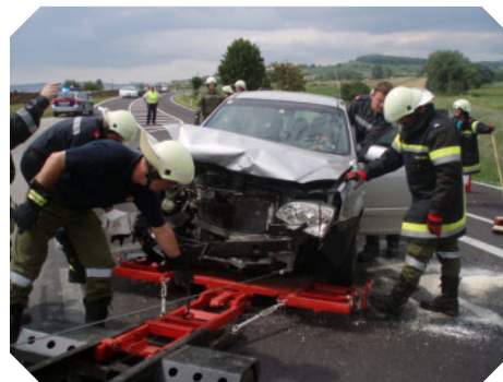
Zusammenstoß zweier PKW am 7. August auf der LH55 Höhe Abfahrt Lengenfeld