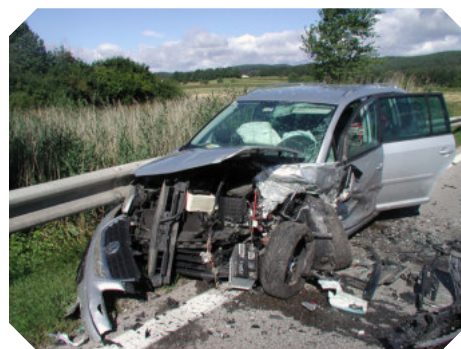
Verkehrsunfall mit Menschenrettung am 9. August auf der B37 bei Droß